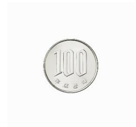
a 100 yen coin

※You need a 100 yen coin to use a lockable storage for your personal belongings. The coin is refundable.