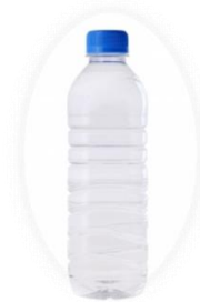
a bottle of water (label-free)