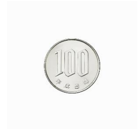
a 100 yen coin

※You need a 100 yen coin to use a lockable storage for your personal belongings. The coin is refundable.